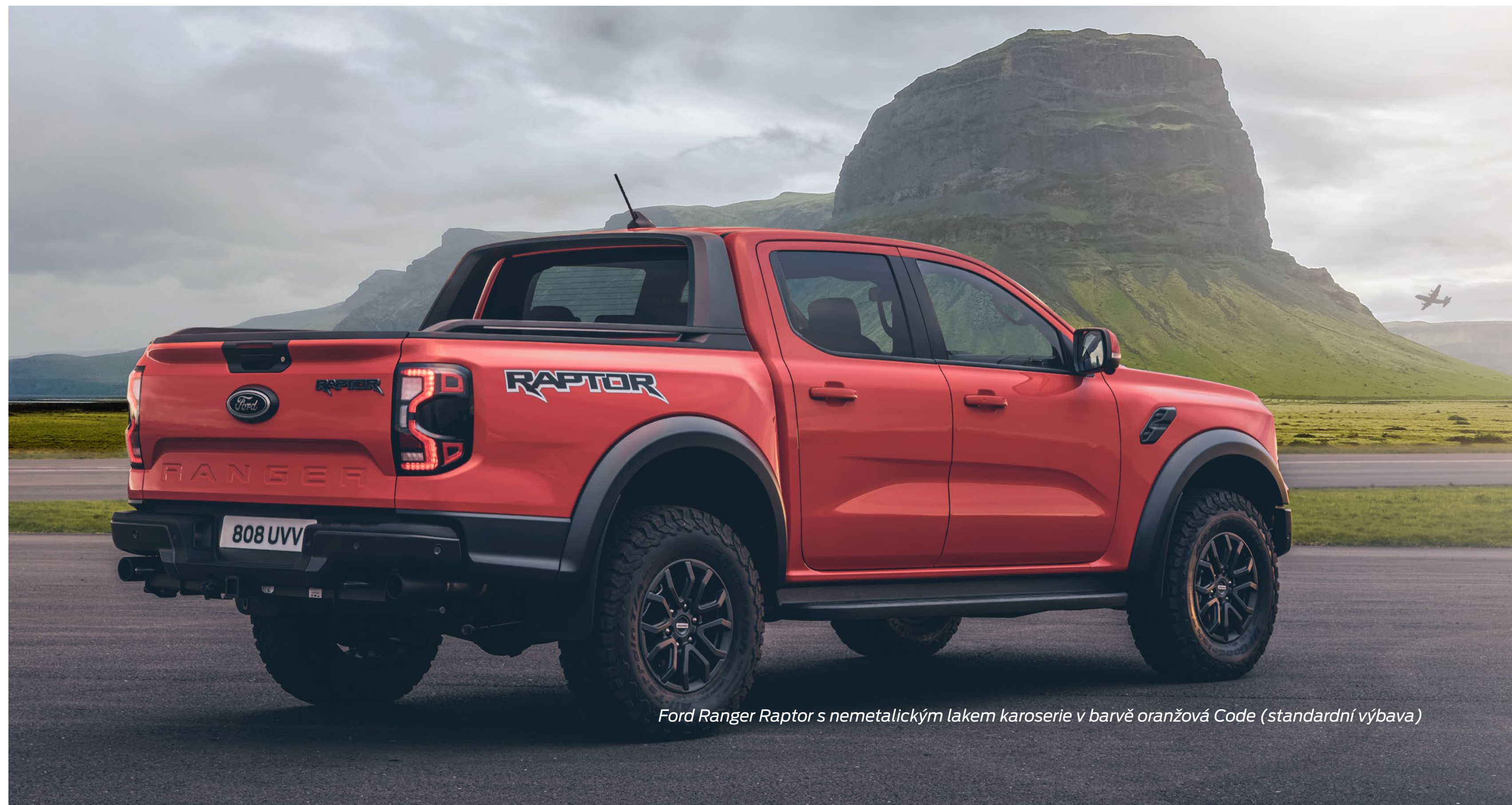
Ford Ranger Raptor s nemetalickým lakem karoserie v barvě oranžová Code (standardní výbava)