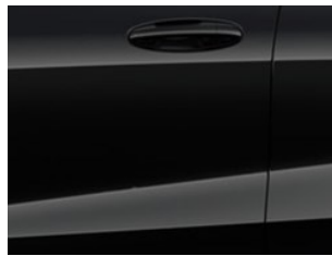
Černá Agate metalická