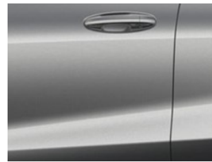
Stříbrná Solar metalická