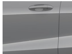
Šedá Matter prémiová nemetická