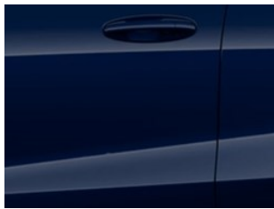
Modrá Blazer nemetická