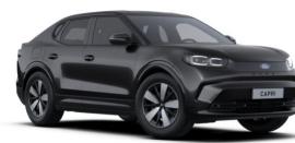
Šedá Magnetic metallická