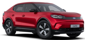
Červená Lucid speciální metallická