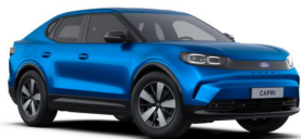
Modrá My Mind speciální metallická