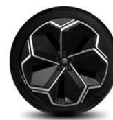
21" kola z lehkých slitin výbava na přání za příplatek