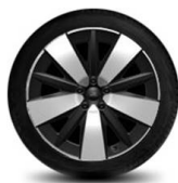
19" kola z lehkých slitin