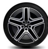
20" kola z lehkých slitin