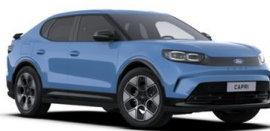
Modrá Tribute nemetická