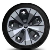
19" ocelová kola standardně pro Style