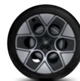
21" kola z lehkých slitin standardně pro Collection