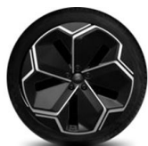
21" kola z lehkých slitin výbava na přání za příplatek pro Premium