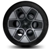
21" kola z lehkých slitin standardně pro Collection