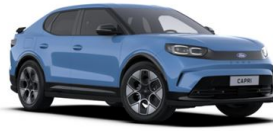
Modrá Tribute nemetallická