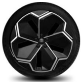
21" kola z lehkých slitin výbava na přání za příplatek pro Premium