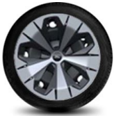
19" ocelová kola standardně pro Style