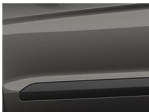
Šedá Magnetic metalická