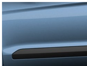
Modrá Metallic metalická