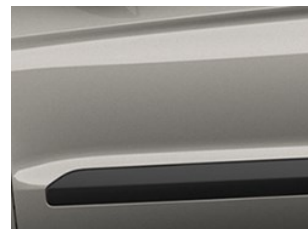
Stříbrná Diffused metalická