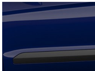
Modrá Blazer nemetická