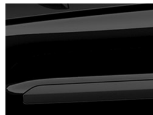
Černá Agate metalická