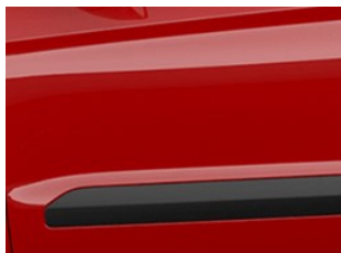
Červená Race nemetická