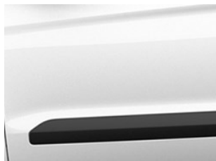
Bílá Frozen nemetická