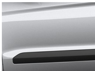
Stříbrná Moondust metalická