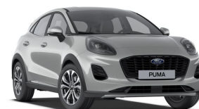
Stříbrná Solar metallická