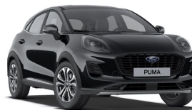
Černá Agate metallická