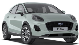
Šedá Cactus nemetallická