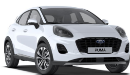
Bílá Frozen speciální nemetallická