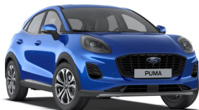
Modrá Desert Island speciální metallická