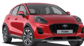
Červená Fantastic unikátní metallická