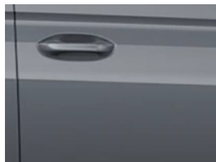
Šedá Comet nemetická