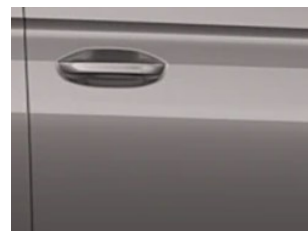
Stříbrná Dusky metalická