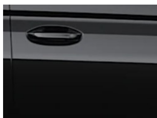
Černá Ink metalická