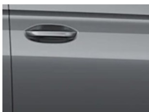
Šedá Graphite metalická