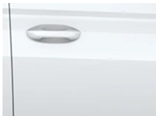
Bílá Frozen nemetická