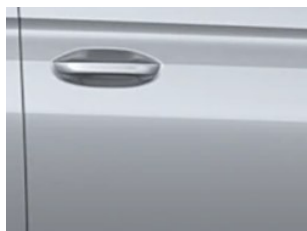
Stříbrná Stardust metalická