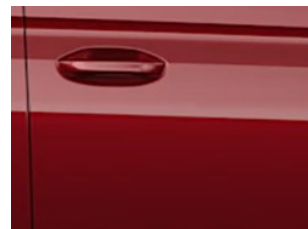
Červená Maple metalická