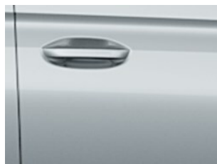
Stříbrná Frost metalická