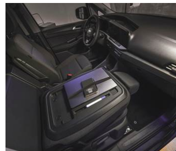
SKLOPNÉ SEDADLO SPOLUJEZDCE PRO LIMITED