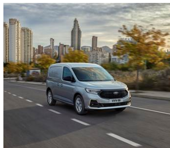
IDEÁLNÍ DO MĚSTA