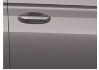
Stříbrná Dusky metalická