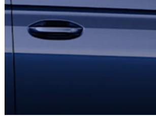
Modrá Midnight metalická