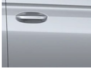
Stříbrná Stardust metalická