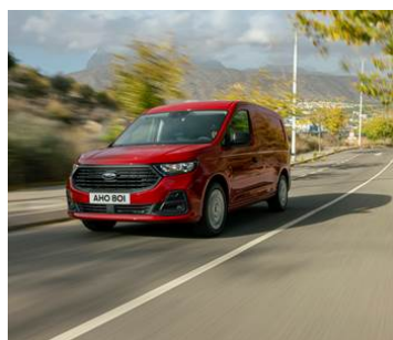
NAFTOVÉ MOTORY 2.0 ECOBLUE A MOŽNOST AWD