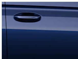
Modrá Midnight metalická