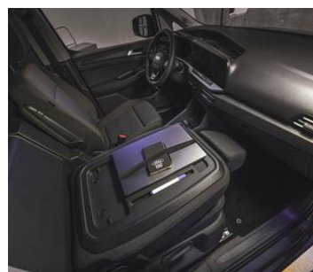
SKLOPNÉ SEDADLO SPOLUJEZDCE