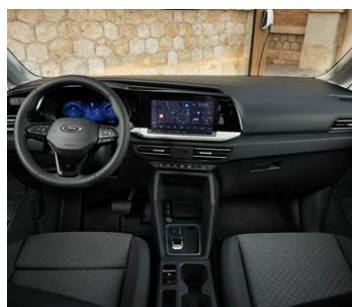
MODERNÍ KABINA S 10" INFOTAINMENTEM