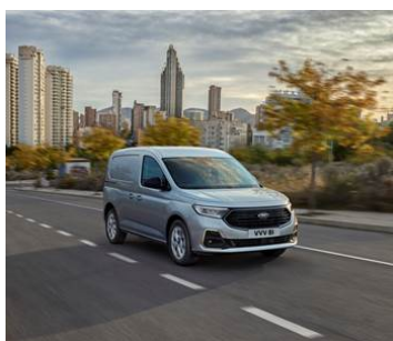
PLUG-IN HYBRID S MOTOREM 1.5 ECOBOOST