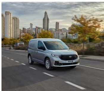
IDEÁLNÍ DO MĚSTA