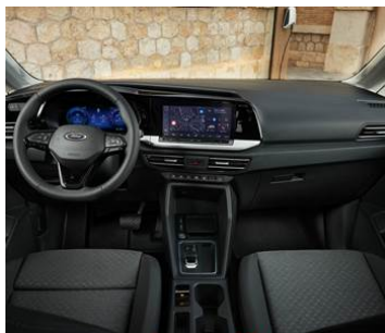
MODERNÍ KABINA S 10" INFOTAINMENTEM