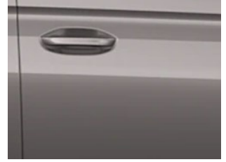
Stříbrná Dusky metalická