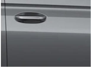
Šedá Graphite metalická