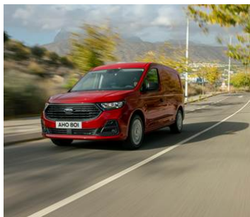
NAFTOVÉ MOTORY 2.0 ECOBLUE