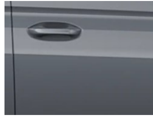
Šedá Comet nemetická