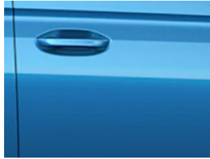
Modrá Boundless metalická