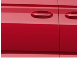
Červená Rhapsody metalická