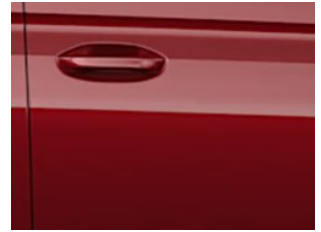
Červená Maple metalická