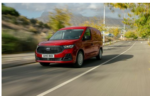
NAFTOVÉ MOTORY 2.0 ECOBLUE