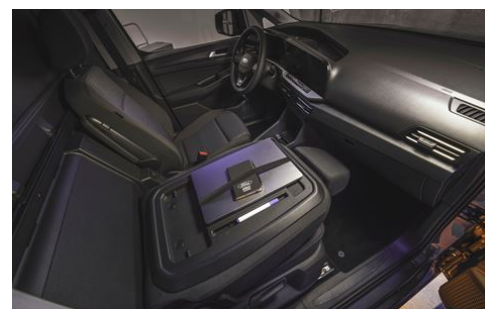
SKLOPNÉ SEDADLO SPOLUJEZDCE