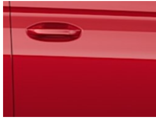
Červená Lava nemetická