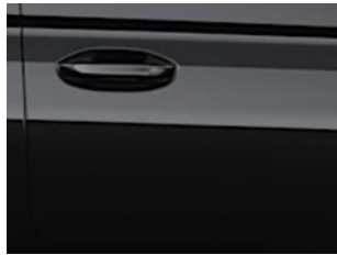
Černá Serene metalická