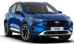
Modrá Desert Island metalická