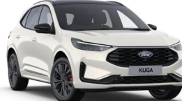
Bílá Metropolis metalická