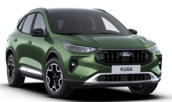
Zelená Bursting metalická