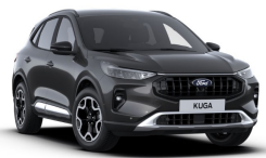
Šedá Magnetic metalická