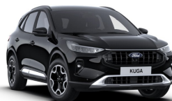
Černá Agate metalická