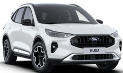
Bílá Frozen nemetallická