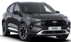
Šedá Magnetic metalická