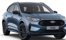
Modrá Vapor metalická