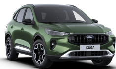
Zelená Bursting metalická