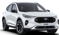
Bílá Frozen nemetická