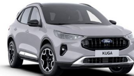
Šedá Matter nemetická