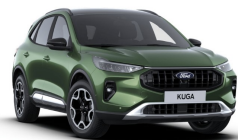
Zelená Bursting metalická