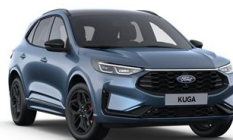
Modrá Vapor metalická