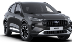
Šedá Magnetic metalická