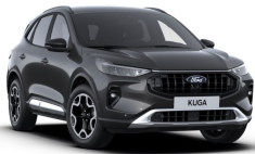
Šedá Magnetic metalická