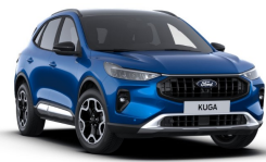
Modrá Desert Island metalická