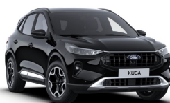
Černá Agate metalická