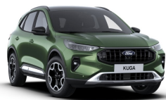
Zelená Bursting metalická