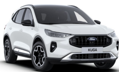
Bílá Frozen nemetická