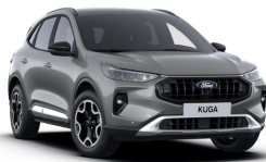
Stříbrná Solar metalická