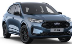
Modrá Vapor metalická