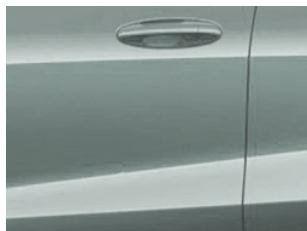
Šedá Cactus nemetická