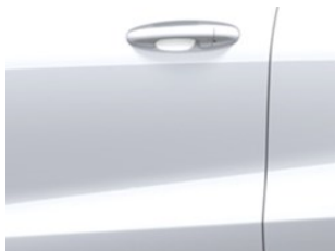
Bílá Frozen nemetická