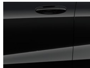
Černá Agate metalická