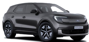
Šedá Magnetic metalická