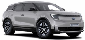
Stříbrná Solar* metalická