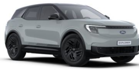
Šedá Cactus nemetická