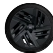
20" kola z lehkých slitin standardně pro Collection