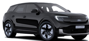
Černá Agate metalická