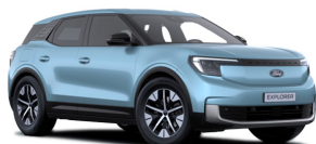
Modrá Arctic metalická