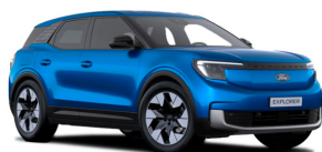
Modrá My Mind speciální metalická