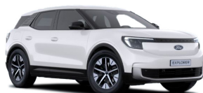
Bílá Frozen nemetická