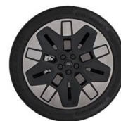
21" kola z lehkých slitin výbava na přání za příplatek