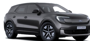
Šedá Magnetic metalická