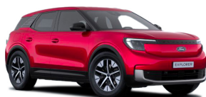
Červená Lucid speciální metalická