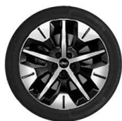
19" kola z lehkých slitin standardně pro Explorer s prodlouženým dojezdem