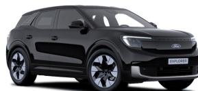
Černá Agate metalická