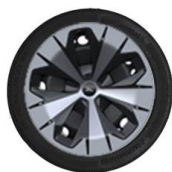
19" ocelová kola standardně pro Explorer se standardním dojezdem