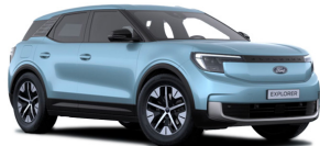
Modrá Arctic metalická