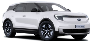
Bílá Frozen nemetallická