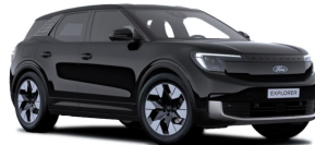
Černá Agate metalická