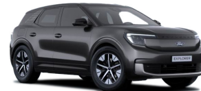
Šedá Magnetic metalická