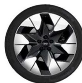
20" kola z lehkých slitin standardně pro Premium