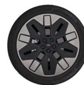
21" kola z lehkých slitin výbava na přání za příplatek