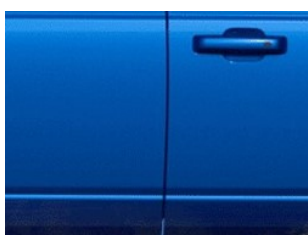
Modrá Velocity metalická