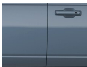
Šedá Azure metalická