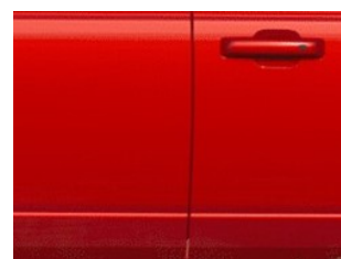
Červená Hot Pepper metalická