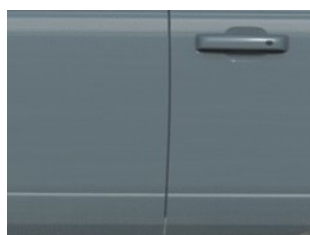
Area 51 nemetická