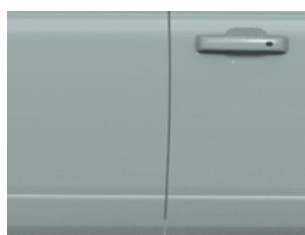
Šedá Cactus nemetická