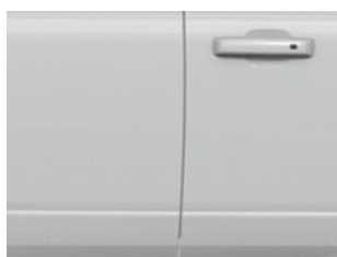
Bílá Oxford nemetická