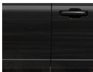
Černá Shadow speciální mica