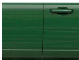
Zelená Eruption metalická