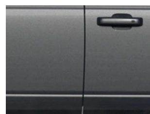
Šedá Carbonized metalická