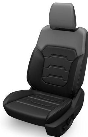
Kůže/vinyl Apex v barvě černá Ebony (standardně pro Limited)