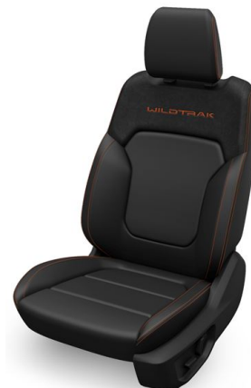
Kůže/vinyl Micro Rib v barvě černá Ebony s prošíváním oranžová Cyber (standardně pro Wildtrak)