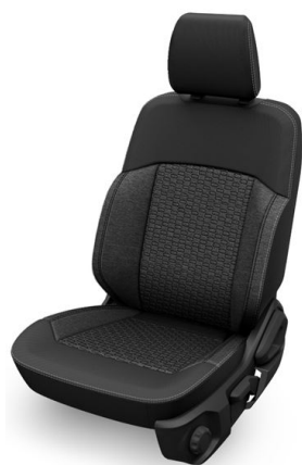
Látka Elevate v barvě černá Ebony (standardně pro XLT)