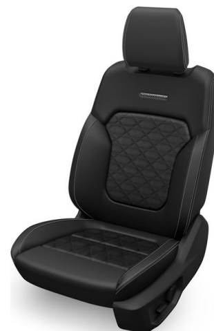
Kůže Quilt Premium s prošíváním světlá Soft Ceramic (standardně pro Platinum)