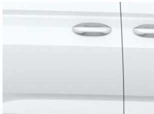
Bílá Frozen nemetická