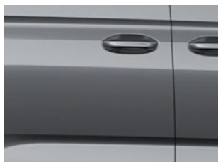
Šedá Graphite metalická