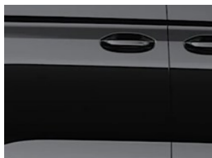
Černá Ink metalická