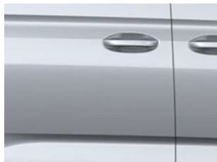
Stříbrná Stardust metalická