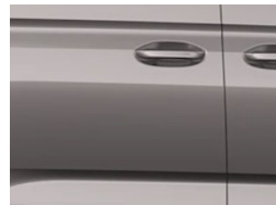
Stříbrná Dusky metalická