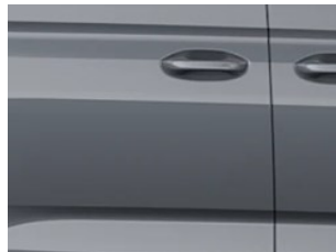
Šedá Comet nemetická