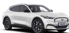
Bílá Star unikátní metalická