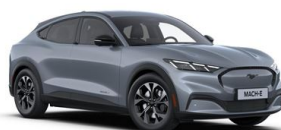
Šedá Glacier unikátní metalická