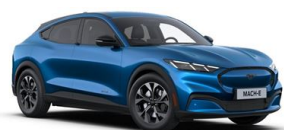
Modrá Velocity unikátní metalická