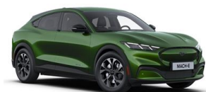
Zelená Eruption unikátní metalická