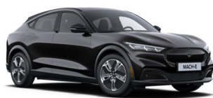
Černá Shadow Mica