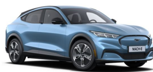
Modrá Vapor metalická