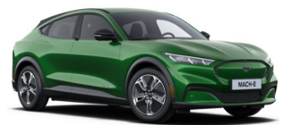
Zelená Eruption metalická