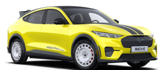
Žlutá Grabber unikátní nemetalická