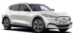
Bílá Star unikátní metalická