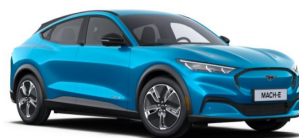
Modrá Grabber unikátní metalická