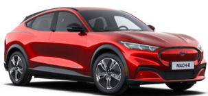
Červená Lucid unikátní metalická