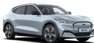
Šedá Glacier unikátní metalická