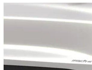
Bílá Star unikátní metalická