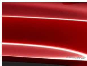
Červená Lucid unikátní metalická