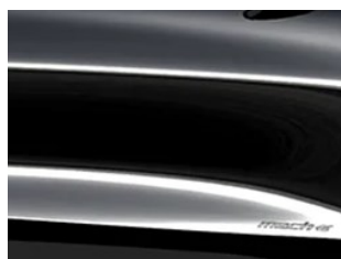
Černá Shadow Míca