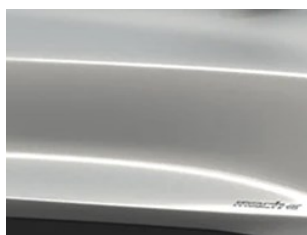
Bílá Space metalická