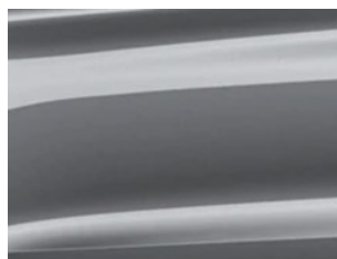
Šedá Carbonized metalická