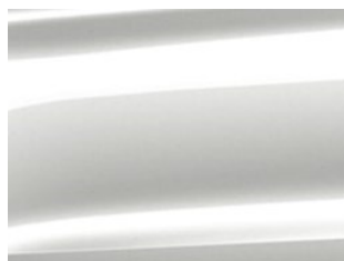
Bílá Star metalická