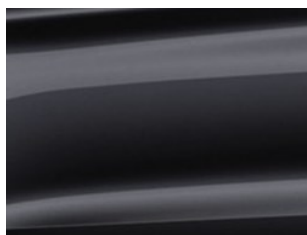
Černá Agate metalická