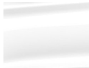
Bílá Oxford nemetalická