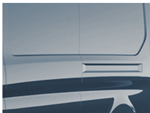
Modrá Metallic metalická