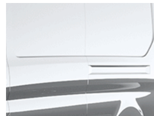
Stříbrná Moondust metalická