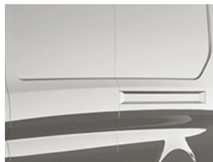
Stříbrná Diffused metalická