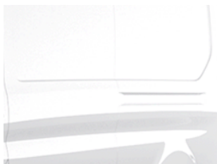
Bílá Frozen nemetická