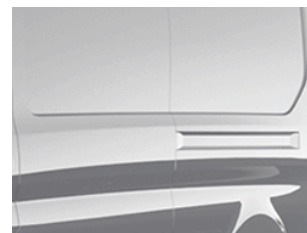
Šedá Matter speciální nemetická