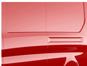
Červená Race nemetická