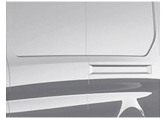
Šedá Matter speciální nemetallická