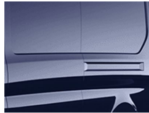
Modrá Blazer nemetallická