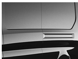
Černá Agate metallická