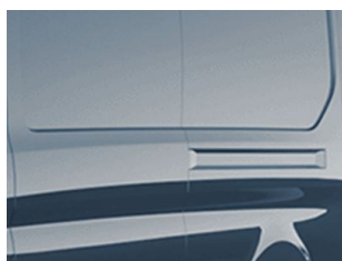
Modrá Metallic metallická