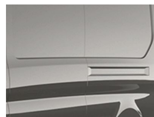
Šedá Magnetic metallická