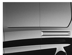
Černá Agate metalická