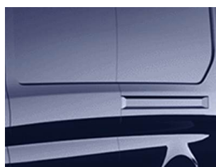
Modrá Blazer nemetallická