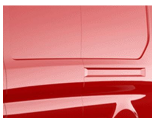
Červená Race nemetallická