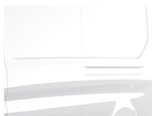
Bílá Frozen nemetallická