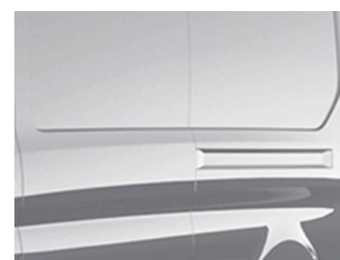
Šedá Matter speciální nemetallická