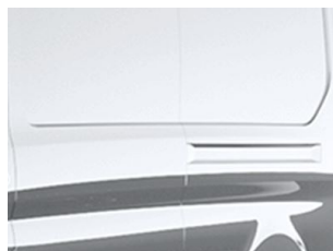
Stříbrná Moon dust metalická