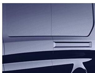
Modrá Blazer nemetallická