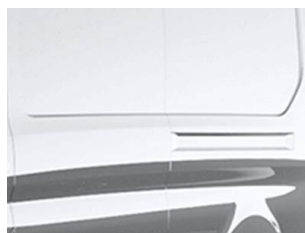
Stříbrná Moondust metalická