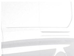
Bílá Frozen nemetallická