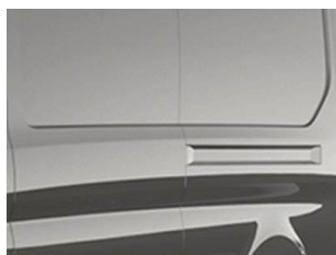
Šedá Magnetic metalická